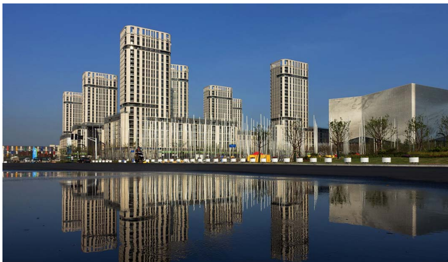
Olimpijsko selo Nandžing 2014.

Hrvatski olimpijski odbor - Ured za olimpijski program, je temeljem ispunjenih kvalifikacijskih normi međunarodnih sportskih federacija izvršio prijavu hrvatskih sportaša na II. Olimpijske igre mladih, prema kojoj je hrvatska sportska delegacija brojila ukupno 44 sudionika. Na igrama je nastupilo 24 sportaša (14 m i 10 ž) te 15 članova stručnih timova i 5 članova Misije. Vrlo slično kao u Singapuru, gdje je ukupno nastupilo 25 sportaša (15 m i 10 ž), te 15 članova stručnih timova i 7 članova Misije.