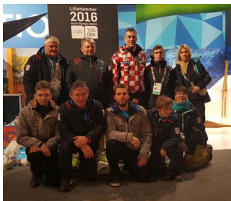
Hrvoje Marušić sa članovima delegacije

Važno je spomenuti da nas je tijekom ZOIM posjetio veleposlanik Republike Hrvatske u Norveškoj, Hrvoje Marušić, koji je posjetio natjecanja, te je organiziran zajednički ručak sa sportašima i trenerima u Olimpijskom selu.