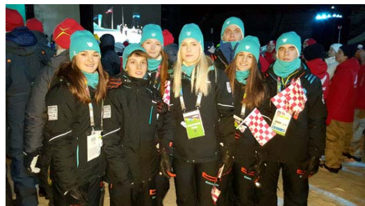
Članovi delegacije na Ceremoniji otvaranja ZOIM