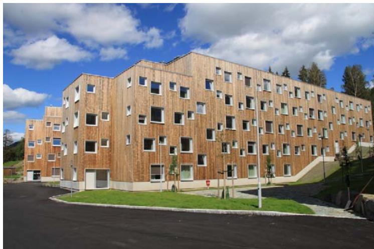
Olimpijsko selo Lillehammer 2016.

sela. Članovi delegacije su imali manje primjedbe na prehranu, jer hrana nije bila dovoljno raznovrsna, tako da smo dodatno kupovali voće, energetske napitke, te ostale dodatke prehrani kako bismo zadovoljili potrebe mladih sportaša. Obzirom da su se natjecanja odvijala na relativno većim udaljenostima od sela u Lillehammeru, članovima delegacije koji nisu stigli na ručak ili večeru, refundirali su se troškovi iz restorana na borilištu ili u blizini istog.