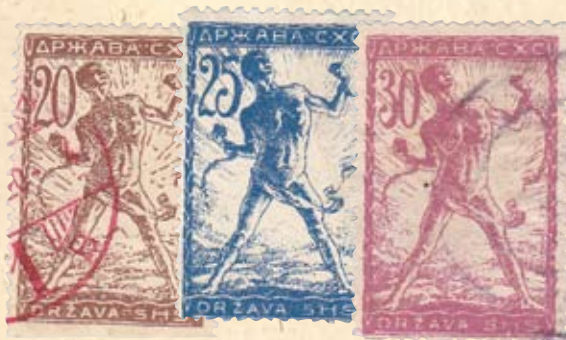
Filatelistička serija s likom Stane Derganca koju je pošta Kraljevine SHS objavila 1919. godine