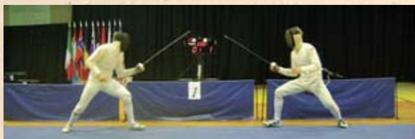
Finalna borba turnira Svjetskog kupa u mačevanju - Kup sv. Duje 2011