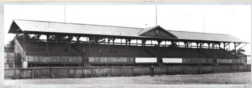
Prve drvene tribine na "Hajdukovu placu"