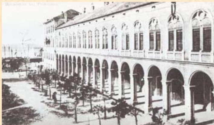
Splitske Prokurative - pod ovim arkadama podučavalo se mačevanje