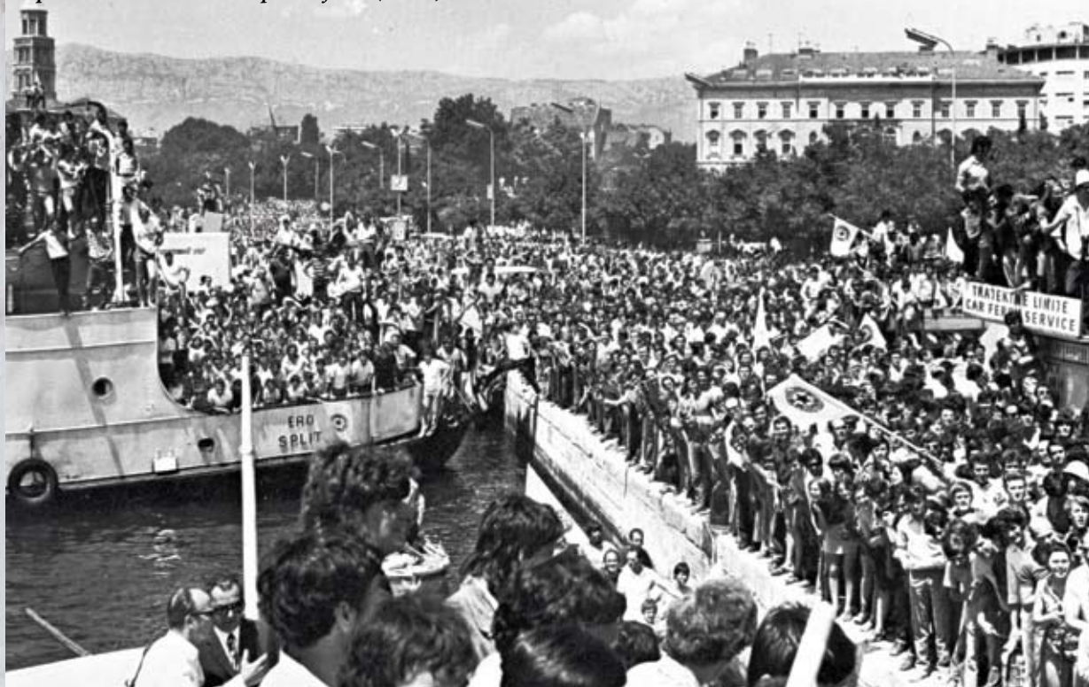
Spektakularni doček na splitskoj rivi (1971.)

A sve je počelo tisuću kilometara daleko od Splita, u hladnom Pragu. Splitski studenti, zalučeni popularnom igrom zvanom nogomet, nakon što su redovito posjećivali treninge i utakmice praških velikana Sparte i Slavije, dolaze na ideju da nogometnu loptu donesu i u svoj grad