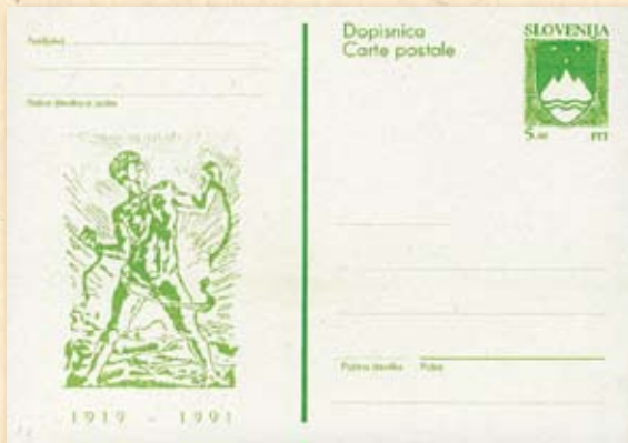
Slovenska dopisnica iz 1991. godine s likom legendarnog „Verigara“

trajala samo tri godine, spone s tim gradom, osobito s gimnastičarima nakon Drugoga svjetskog rata okupljenima u Društvu tjelesnog odgoja „Partizan“ zadržao je do kraja života. Pedesetih godina znao je ljeta provoditi u Splitu kao trener kojega generacije splitskih gimnastičara pamte kao iznimno strogog; bio je disciplinirani autoritet koji se jedino opuštao na čestim klupskim izletima u Supetar gdje je uživao u plivanju. Već u poznoj životnoj dobi, 1979. godine, kao dragi gost i prijatelj, nazočio je Mediteranskim igrama u Splitu, što je ujedno bio njegov posljednji posjet ovom gradu.