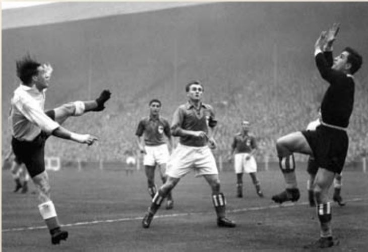
Vladimir Beara u reprezentaciji Europe

ma trenersko mjesto u klubu kojeg će s prekidima voditi puna dva desetljeća.