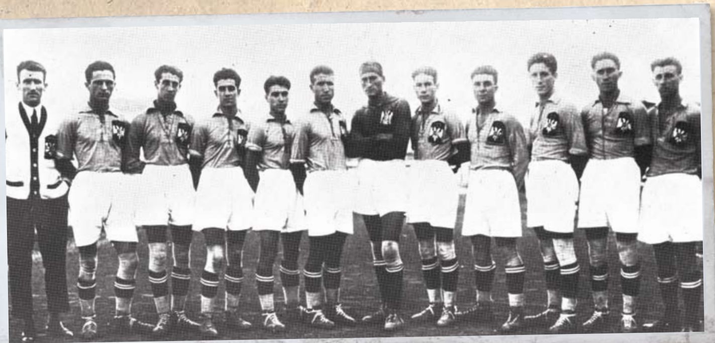
Deset igrača Hajduka nastupilo je za reprezentaciju Jugoslavije! (1924.)