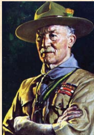
Robert Baden-Powell, utemeljitelj skautske organizacije, na prvoj međunarodnoj skautskoj smotri svijeta 1920. godine proglašen je Glavnim skautom svijeta (Chief Scout)

Na prostoru logora bilo je 673 šatora i četiri barake za upravu, prehranu, kantu i trgovinu skautske opreme. Skauti su dobivali sirove namirnice koje su sami morali kuhati u sklopu svojih jedinica. Logor je bio opskrbljen rasvjetom, vodom, telefonom, radiostanicama, sanitarnim čvorovima te šatorom za pružanje prve pomoći. Organizirana su natjecanja za prvenstvo Saveza u skautskim vještinama, lakoj atletici, plivanju, odbojci gađanju puškom te lukom i strijelom.