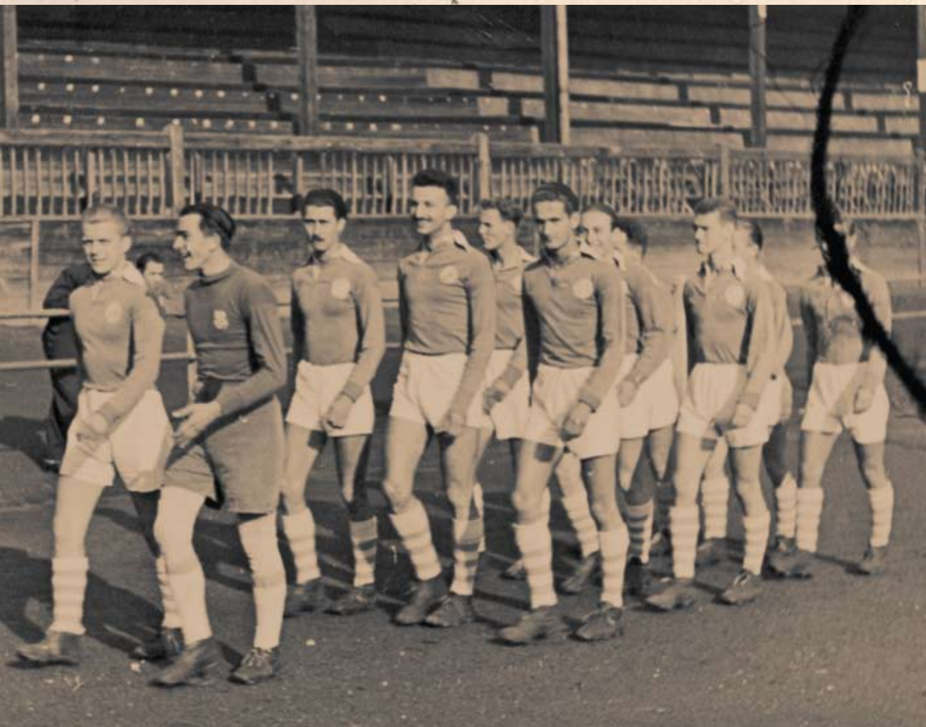
građanskog športskog kluba na svom stadionu u Koranskoj ulici 14. IX.1941. godine.

mjesto osvojila je reprezentacija Državne I. muške realne gimnazije.