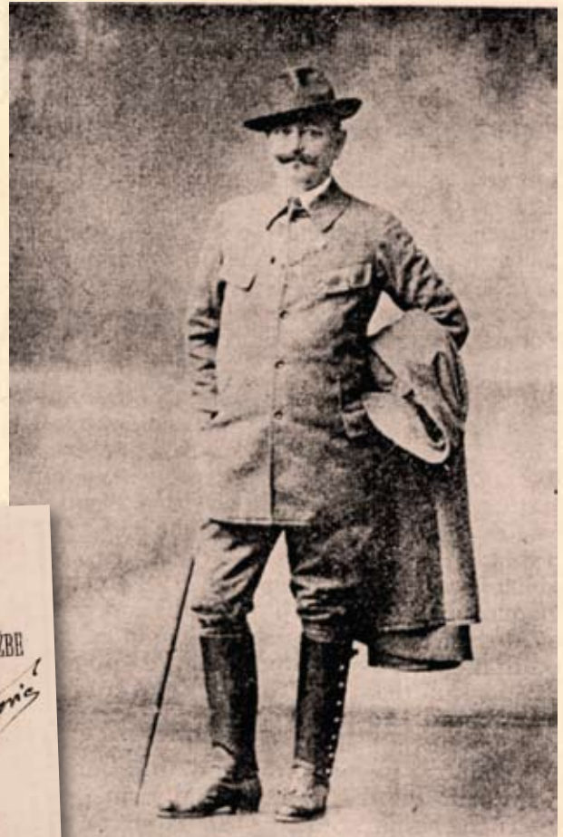
Prof. Mate Mudrinić, prvi hrvatski skaut

Godine 1913. počele su se osnivati „dačke izletne družbe“ pri Gimnaziji u Karlovcu, Realnoj gimnaziji u Zagrebu te iduće godine na Kraljevskoj maloj gimnaziji u Koprivnici. Bila je riječ o skupinama od najviše dvana-