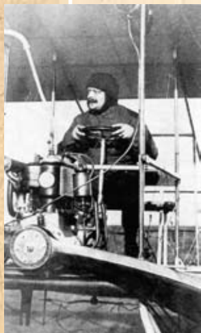
Konstruktor prvog hrvatskog zrakoplova Slavoljub Penkala

Inženjer Slavoljub Penkala (1871.-1922.), nakon što je patentirao i pokrenuo proizvodnju penkala olovke, počeo se od 1908. ozbiljno zanositi avijacijom i godine 1908. i 1909., prijavio je Uredu za patente dva uređaja koji olakšavaju upravljanje zrakoplovima.