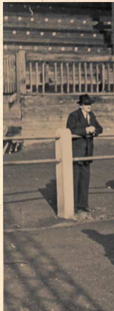
Rukometna ekipa I. hrvatskog

Prvo rukometno prvenstvo zagrebačkih srednjih škola organizirano je u školskoj godini 1935/36. uz sudjelovanje reprezentacija realnih i klasičnih gimnazija. Prvo