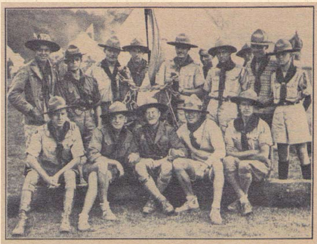
Jamboree 1929: Članovi Saveza skauta Kraljevine Jugoslavije na Trećem svjet- skom Jamboree- ju 1929. godine u Arrow Parku, Birkenhead u Velikoj Britaniji

Hrvatski izviđači-skauti članovi su svjetske skautske obitelji već gotovo čitavo stoljeće. U duhu skautske ideje da se svijet ostavi barem malo boljim nego što smo ga zatekli te pod motom "Budi pripravan" i na ovim je prostorima već stotinjak generacija djetinjstvo provelo učeći praktična životna iskustva na nekonvencionalan način - u društvu svojih vršnjaka uz žubor potoka i pucketanje logorske vatre.