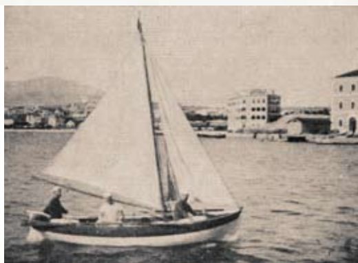
Jedrilica "Angjeo" obitelji Katalinić (u pozadini dom "Adrije" i kuća Katalinić)

U godini održavanja prvih suvremenih olimpijskih igara, 1896., obilježena je šesta obljetnica djelovanja "Adrije" s dva velika društvena događaja. U foyeru tri godine ranije izgrađenog Hrvatskog kazališta u Splitu, organiziran je 5. veljače svečani ples, prvi takvog tipa u ovom gradu čiji športski klubovi do danas njeguju ovu